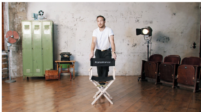
Frederick Lau: UFA und Cancel Cancer

Es war uns sehr wichtig, aus der passiven Betroffenheit eine aktive Hilfe zu machen. Wir wollten nicht nur Mitgefühl zeigen, sondern konkret handeln. Durch Aufklärung, Transparenz und direkte Hilfe streben wir danach, Hoffnung zu verbreiten und zu zeigen, dass jeder einen Unterschied machen kann. Diese positive Energie wollen wir in die Gesellschaft tragen.