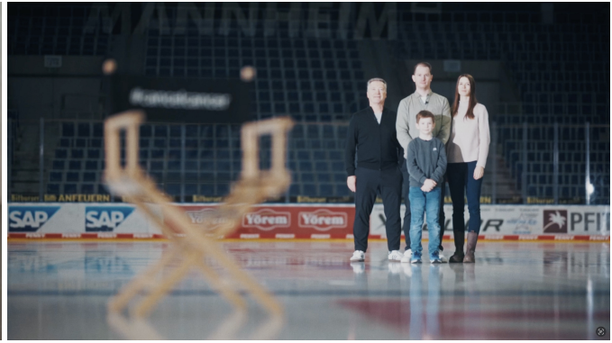
Die Erfolgsgeschichte von Leo