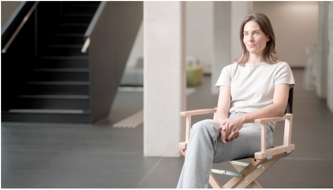
Die Stimme der Expert*innen